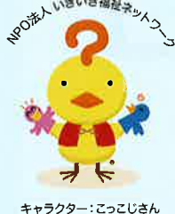
キャラクター：こっこじさん