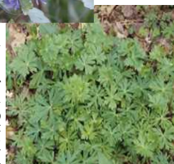
トリカブトの芽生え