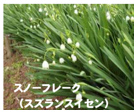
スノーフレーク (スズランスイセン)