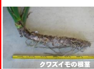
クワズイモの根茎