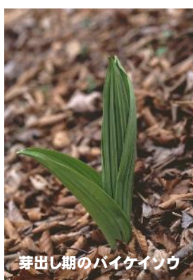
芽出し期のバイケイソウ