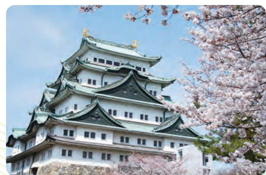
名古屋城(名古屋市・中区)

学びも出会いも、そして未来へのヒントも、たくさん持って帰っていただけるよう、初夏の名古屋で皆さまのお越しをお待ちしております。