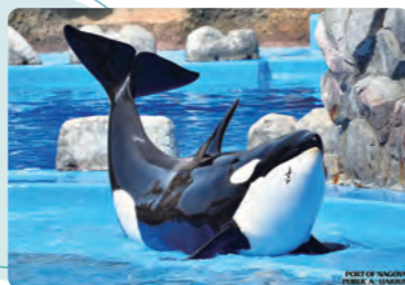
名古屋港水族館(名古屋市・港区)

大会HP https://www.k-gakkai.jp/daycare2026/index.html