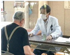
通所リハ時の医師の説明