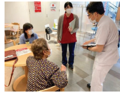
併設医療機関外来受診後のリハ会議と医師の説明