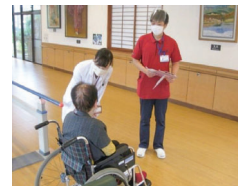
短期入所時の医師の説明

Geriatric Health Service Facilities SEIGAEN