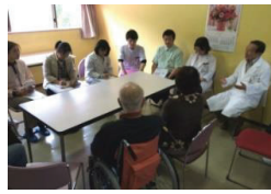
施設でのリハ会議と医師の説明