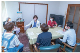
居宅でのリハ会議と医師の説明